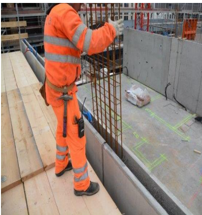
Schnelle und rationelle Verlegung