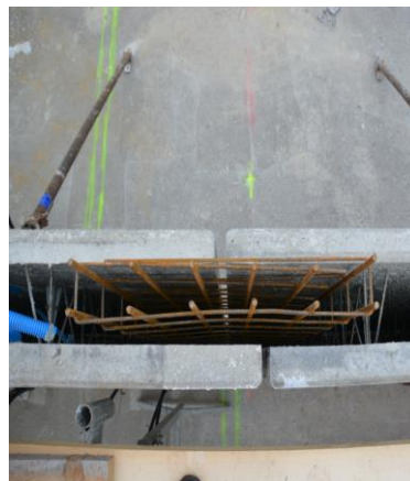
Anwendung Stossverbindung in Doppelwand